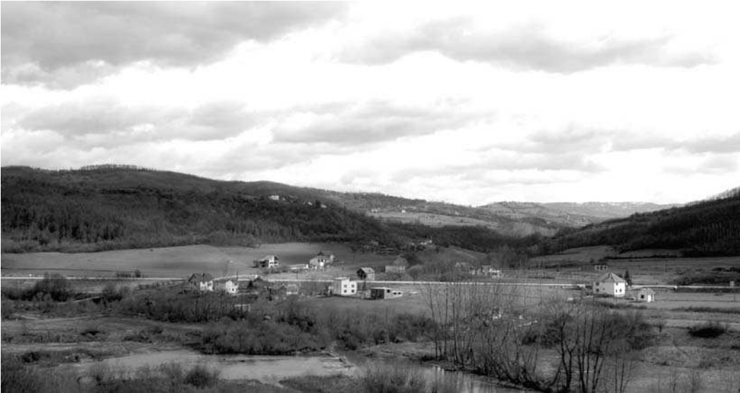
Слика 1 - Поглед на локалитет Пиљаковац Figure 1 - View on the site Pijakovac

којима су отворене четири пробне сонде, различитих димензија, укупне површине 102 m 2 . Током археолошких истраживања налазишта Пиљаковац, констатовани су остаци значајнијег праисторијског насеља као и мање средњовековне насеобине. Средишни део ових насеља ситуиран је у источном делу налазишта, односно секторима I и II, који су удаљени око 40 m од магистралног пута Лесковац - Врање. Сонде у секторима III и IV отворене су у југозападном, односно североисточном делу налазишта што уједно представља и крајње границе ширења овог већег праисторијског насеља.