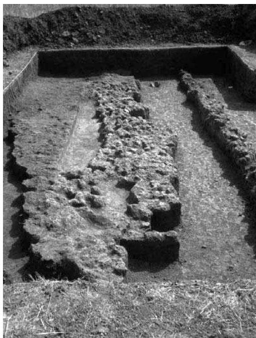
Слика 2 - Остаци стамбеног објекта у сектору 2 Figure 2 - Remains of the house in sector 2

Cultural layers in all of the trenches lie on a layer of sterile gray clay. The thickness of the cultural layer varies from 0.4 to 2.1 m. Four horizons were registered in trenches in sectors I and II. Right above the sterile soil, in the deepest layer, pottery shards were discovered with the characteristics of the very end of the fully developed Bronze Age (14 th -13 th century BC). The most significant finds from this layer are pear shaped