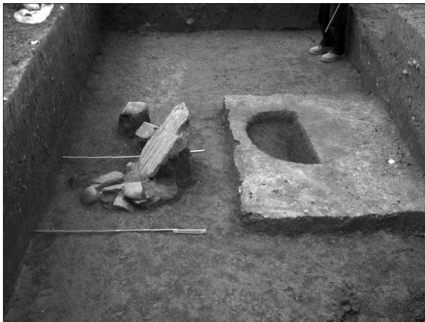
Слика 3 - Остаци јама и камене конструкције у сонди 1, сектор 1 Figure 3 - Remains of pit-hole and stone construction in trench 1, sector 1

Iron Age (12 th -10 th century BC). Pottery from this layer is mostly polished with bowls, amphorae, beakers and jugs as dominating vessel types. Ornaments on vessels were mainly done in channeling technique. Immediately on the described layer lie the remains of dwellings dated