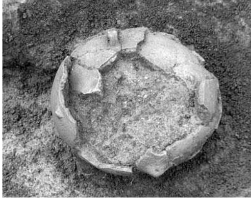
Слика 4 - Амфора из слоја III Figure 4 - Amphora from layer III

Rescue excavations on archaeological site Piljakovac provided extremely valuable data about the complex nature of ethno-cultural changes that marked the transition period between the Late Bronze and Early Iron Age. This site is also very significant due to its very well preserved stratigraphy and numerous archaeological artifacts as opposed to many of the sites of this period in this part of Serbia.